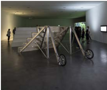
Urban-Think Tank (ETH Zürich) In collaboration with MOON Kyungwon & JEON Joonho Mobile Agora (Tribune), 2015 Aluminium, Holz, Räder 3 Teile: je 181 x 340 x 425 cm