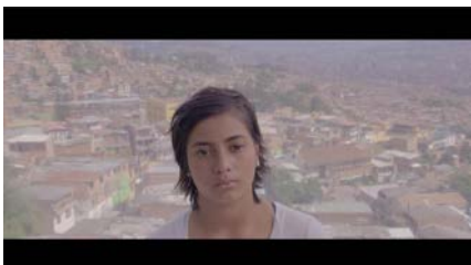
Urban-Think Tank (ETH Zürich) & Gran Horizonte Media In collaboration with MOON Kyungwon & JEON Joonho Mobile Agora (Remix Agora), 2015 1-Kanal Videoprojektion (Farbe, Ton) 04:00 Min.