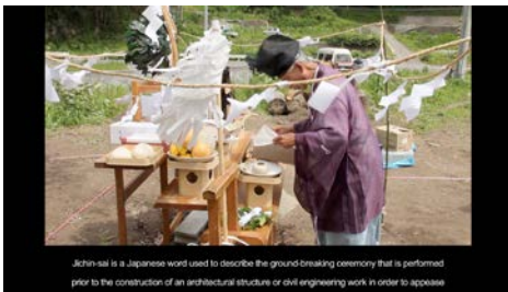
Toyo Ito 'Home-for-All' in Rikuzentakata, 2012 1-Kanal Video auf Monitor (Farbe, ohne Ton) 10:09 Min.