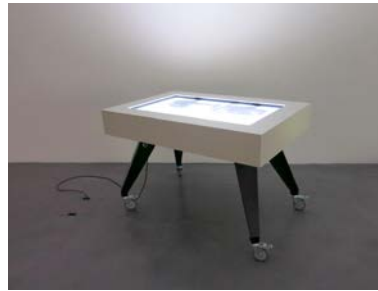
Future Cities Laboratory/Lehrstuhl für Informationsarchitektur (ETH Zürich) Teaching the Unknown, 2015 Tisch, Räder, Kabel, Intel® NUC Prozessor, Touchscreen, Application Software 86 x 130 x 85 cm