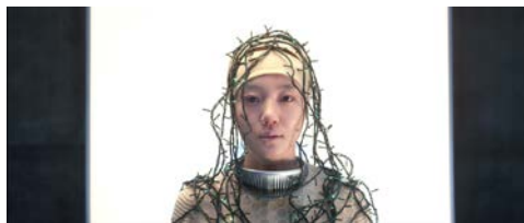
MOON Kyungwon & JEON Joonho El Fin del Mundo , 2012 2-Kanal-Videoprojektion (HD, Farbe, Ton) 13:35 Min.