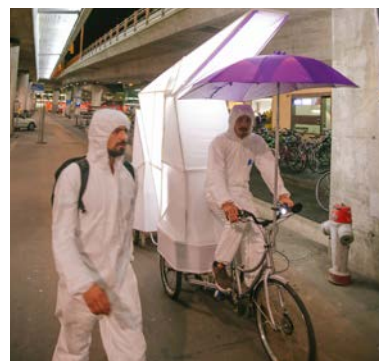
Urban-Think Tank (ETH Zürich) & Gran Horizonte Media In collaboration with MOON Kyungwon & JEON Joonho Mobile Agora (La continuación del mundo), 2015 1-Kanal Video auf Monitor (Farbe, Ton) 04:30 Min.