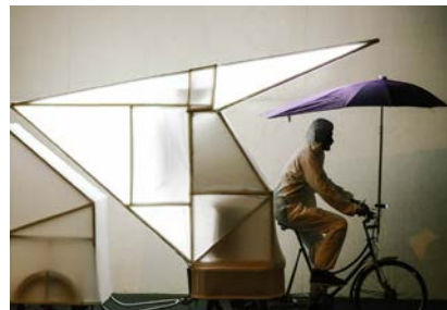
Urban-Think Tank (ETH Zürich) In collaboration with MOON Kyungwon & JEON Joonho Mobile Agora (Mothership), 2015 Fahrrad, Schirm, Monitor, Batterie, Projektor, Verstärker, Fluoreszenzröhren, Kabel, Vorhang, Klettverschluss, Aluminium, Holz 255 x 82 x 360 cm