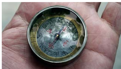
MOON Kyungwon & JEON Joonho Avyakta , 2012 2-Kanal-Videoprojektion (HD, Farbe, Ton) 17:56 Min.