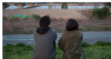
Chapter 4: Housenka, Arakawa River

1-Kanal Videoprojektion (Farbe, Ton) 22:15 Min.