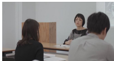
Chapter 2: Situation

1-Kanal Video auf Monitor (Farbe, Ton) 24:09 Min.