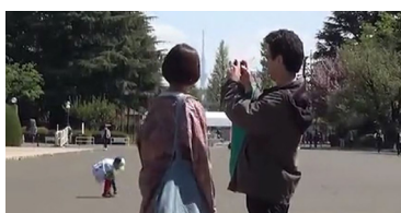
Appendix: Day off

1-Kanal Video auf Monitor (Farbe, Ton) 18:33 Min.