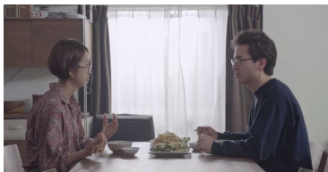
Chapter 1: Two Letters

Commissioned by Migros Museum für Gegenwartskunst.