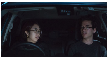
Chapter 5: Night

1-Kanal Videoprojektion (Farbe, Ton) 19:44 Min.