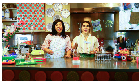
Mary Maggic, Housewives Making Drugs , 2017, Video-still.

Anmeldung unter: kunstvermittlung@ migrosmuseum.ch (bitte über das angehängte Formular)